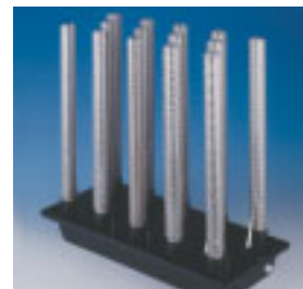
NEU: aerotron 2000

Bei größeren Objekten ist die Luftreinigung und -entkeimung mit Spezialanfertigungen realisierbar. Die besonderen Bedingungen beim Anwender werden berücksichtigt, indem einzelne Gerätekomponenten optimal aufeinander abgestimmt werden.